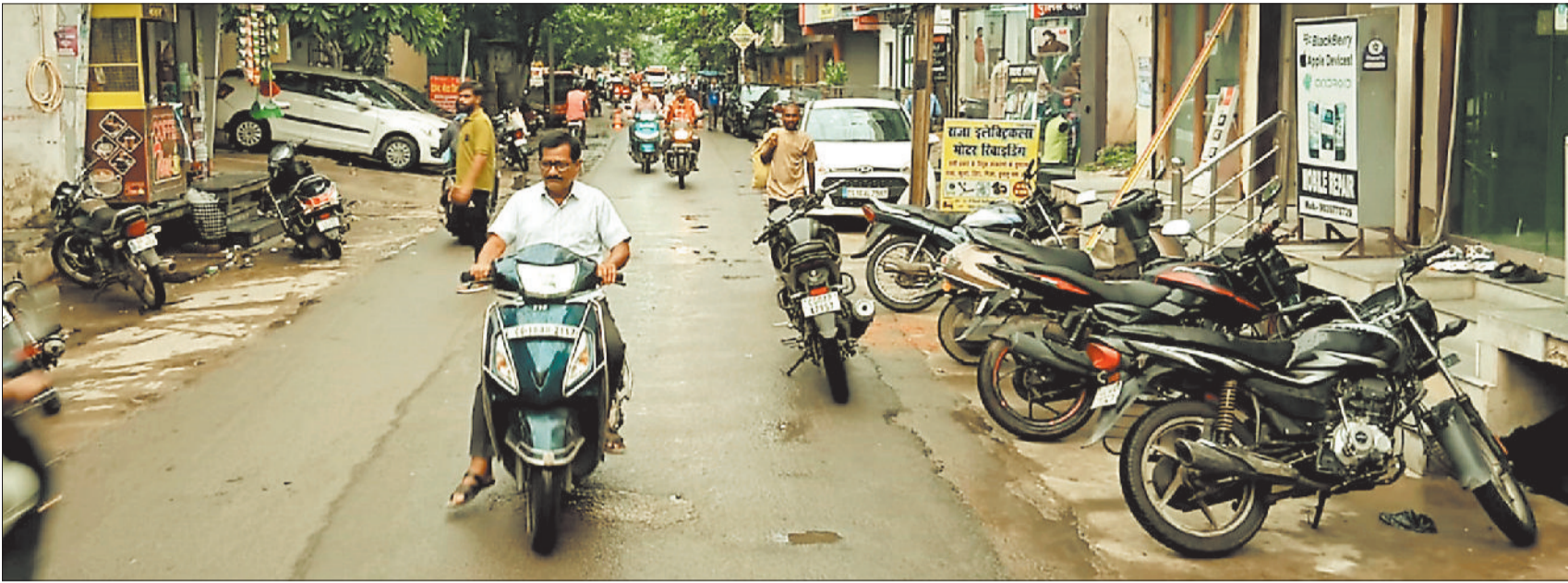
राजेंद्र नगर चौक से बृहस्पति बाजार जाने वाली संकरी सड़क।

शहर की यातायात व्यवस्था दुरुस्त करने और पैदल चलने वालों की सुरक्षा के लिए प्रशासन की कोशिशें नाकाम साबित हो रही हैं। अधिकांश सड़कों पर दोनों तरफ कब्जा है। अधिकांश फुटपाथों पर अतिक्रमण कर लिया गया है। यह एक ऐसी समस्या है, जो वर्षों से चली आ रही है और अभी तक इसका कोई उपयुक्त समाधान नहीं खोजा जा सका है। दुकानदारों का सामान दुकानों में कम सड़क पर अधिक रखा जाता है। सड़क पर कच्चे निर्माण कर लिए गए हैं तो शोध बना लिए गए हैं। बाजार में भीड़ होने के कारण कई दुर्घटनाएं भी घटित हो चुकी हैं, लेकिन दुकानदार अपनी आदत से मजबूर बने हुए हैं। शहर में शायद ही कोई ऐसा क्षेत्र होगा जहां पर कब्जा न हो। सड़कों पर सज्जी-फूल, पेय पदार्थ, चाट, दैनिक उपयोग की वस्तुएं, कपड़े का कारोबार तक हो रहा है।