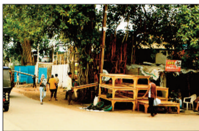
निगम के मुताबिक लकड़ी टाल को शिफ्ट करने के बाद सड़क को चौड़ा किया जाएगा।