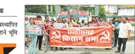
जागरूकता रैली में शामिल भूविस्थापित।

छत्तीसगढ़ किसान सभा और भूविस्थापित रोजगार एकता संघ ने बरसों पुराने भूमि