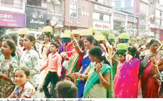
भोजली विसर्जन के दौरान उपस्थित महापौर, भाजपा जिला अध्यक्ष एवं अन्य तथा भोजली विसर्जन के लिए जाते हुए महिलाएं।