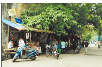
निगम के मुताबिक लकड़ी टाल को शिफ्ट करने के बाद सड़क को चौड़ा किया जाएगा।