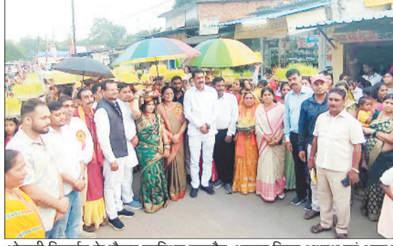
भोजली विसर्जन के दौरान उपस्थित महापौर, भाजपा जिला अध्यक्ष एवं अन्य तथा भोजली विसर्जन के लिए जाते हुए महिलाएं।

भोजली विसर्जन का अदभुत और विहंगम नजारा रक्षाबंधन के दूसरे दिन नदियों और तालाबों के घाटों में नजर आता है। जब बड़ी संख्या में महिलाएं घर में उगाए गए भोजलियों को लेकर गांव की गली और शहर के मुख्य सड़कों से होकर गुजरते हुए देवी गंगा की गीतों के धुन पर घाट पहुंचती हैं। ग्रामीण अंचलों में सूर्य ढलते तक चलता रहा। गाजे बाजे के साथ देवी गंगा के गीत गाते चल रही महिलाओं का समूह से शहर का मुख्य मार्ग की रोक देकर देखते ही बन रही थी। शहर के टेंगुरनाला घाट बालको के राम मंदिर छठघाट, भवानी मंदिर घाट जैसे स्थानों में भोजली विसर्जन के दौरान इस परंपरा को देखने