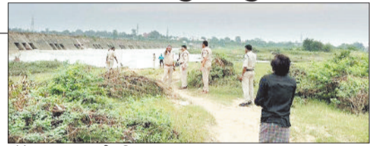
मौके पर जांच करती पुलिस।

एक 10 वर्षीय मासूम की लाश हसदेव दर्रा बराज के एनीकट में मिली है। लाश मिलने की सूचना पर पुलिस की टीम मौके पर पहुंची थी जहां मासूम के शव को एनीकट से बाहर निकाला गया लेकिन मासूम की शिनाख्त नहीं हो पाई है जिससे पुलिस के मुश्किलें बढ़ गई हैं। आखिर मासूम का शव कहाँ से आया और कैसे पहुंचा यह समझ से परे है। पुलिस की टीम मामले की तहकीकात पर जुटी हुई है। फिलहाल पुलिस उसकी शिनाख्ती के प्रयास में जुटी हुई है। युवक की मौत कैसे और किन परिस्थितियों में हुई है यह स्पष्ट नहीं हो पाया है पुलिस का कहना है कि पीएम रिपोर्ट मिलने के बाद ही मासूम की मौत के वास्तविक कारणों का गंभीरता से तहकीकात में जुटी हुई है।